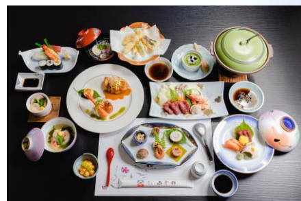
季節の会席 6,000 円料理例(11品)